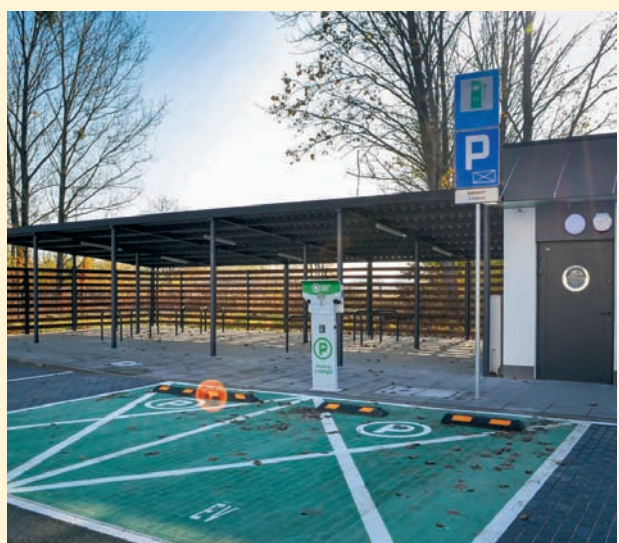
Czyt. str. 4