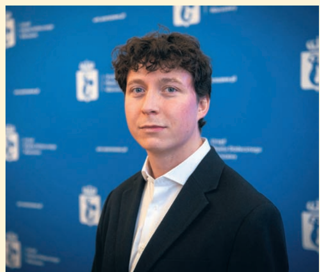
Czyt. str. 8