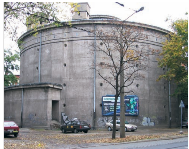
Naziemny schron dla mieszkańców z czasów II wojny światowej.

Warszawa podjęła się zadania zidentyfikowania miejsc w swoim obszarze administracyjnym, mogących służyć jako potencjalne ukrycia dla mieszkańców stolicy na wypadek zewnętrznego zagrożenia państwa. Prace inwentaryzacyjne trwały około 2 miesięcy. Pracownicy miasta wspólnie ze stra-