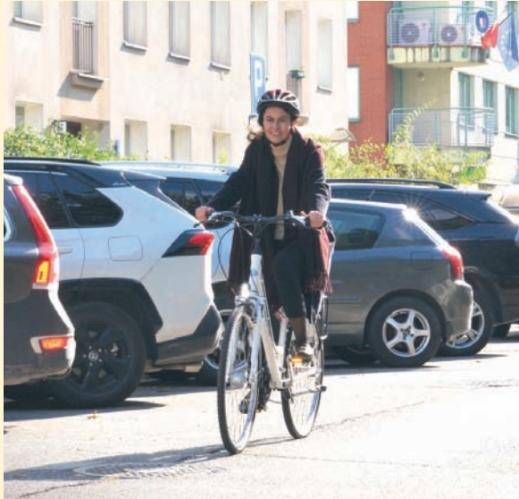
Czyt. str. 3 i 6