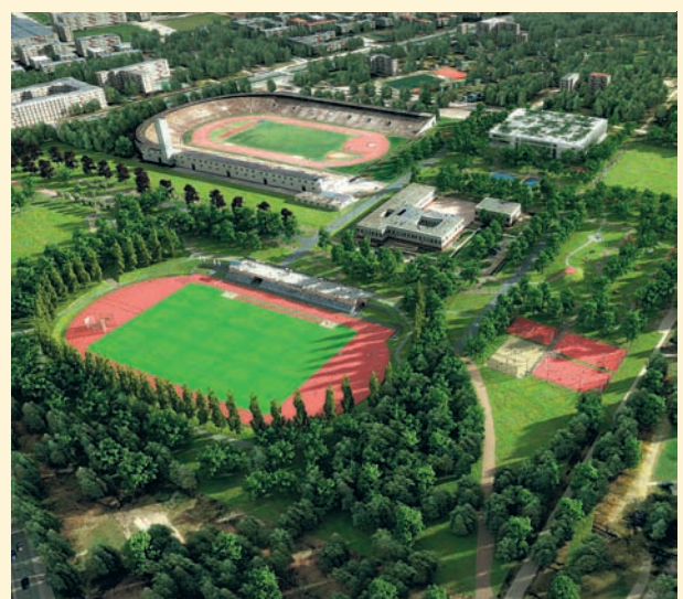
Czyt. str. 11