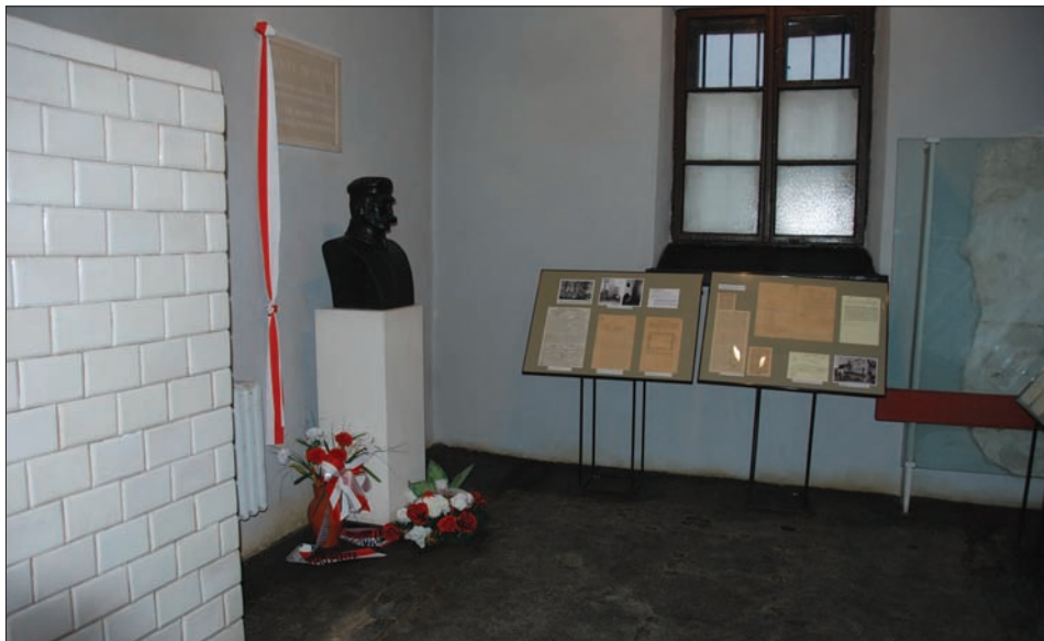
Cela Piłsudskiego w X Pawilonie Cytadeli Warszawskiej.

Na Mokotowskiej Józef Piłsudski mieszkał do 29 listopada 1918 r. Tego dnia około północy udał się do Belwederu, który wówczas stał się jego rezydencją