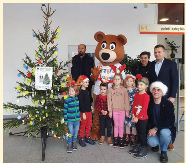
Czyt. str. 4