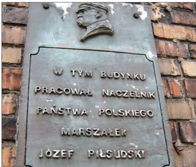
Tablica przy ul. 11 Listopada.

W roku 1989 po raz pierwszy w Polsce opublikowano dwutomowe dzieło Wacława Jędrze-