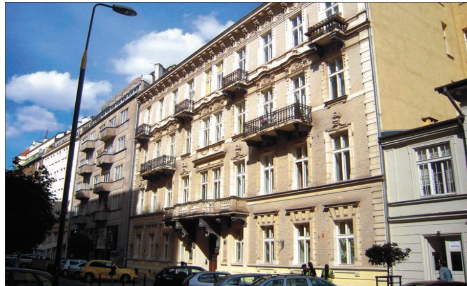
Mokotowska 50 - jeden z adresów J. Piłsudskiego w Warszawie.

Józef Piłsudski jest postacią niezwykle barwną i zasłużoną dla Polski, nic też dziwnego, że zaliczany jest do wąskiego grona „Ojców Polskiej Niepodległości”.