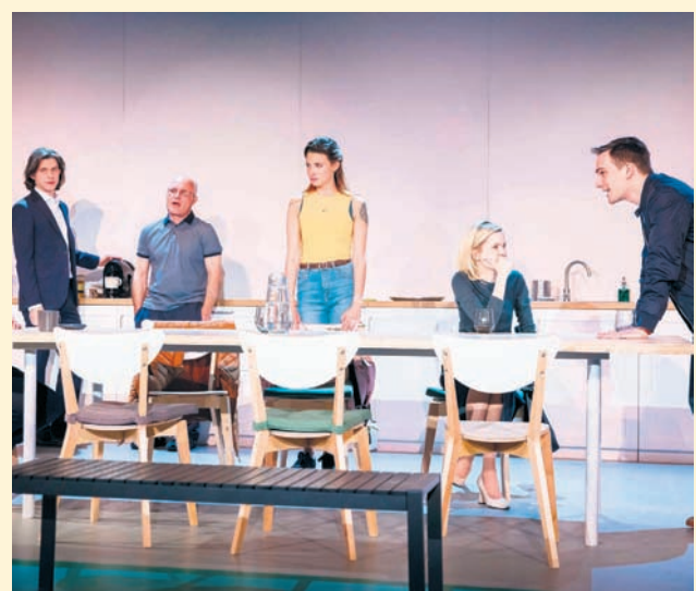
Czyt. str. 14