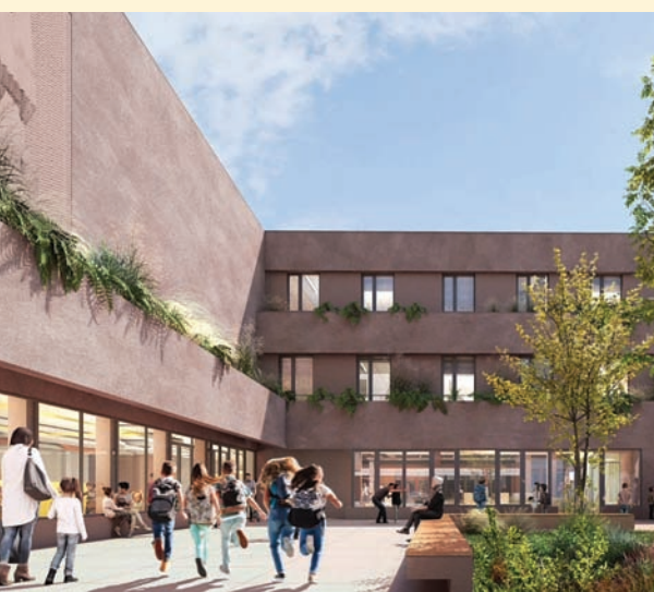
Czyt. str. 8