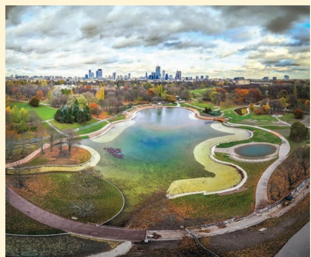
Czyt. str. 11