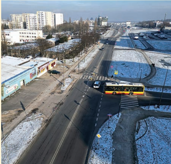
Czyt. str. 4