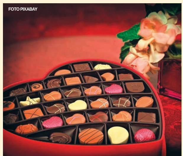
Czyt. str. 3