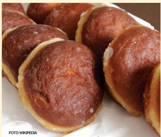
Czyt. str. 3